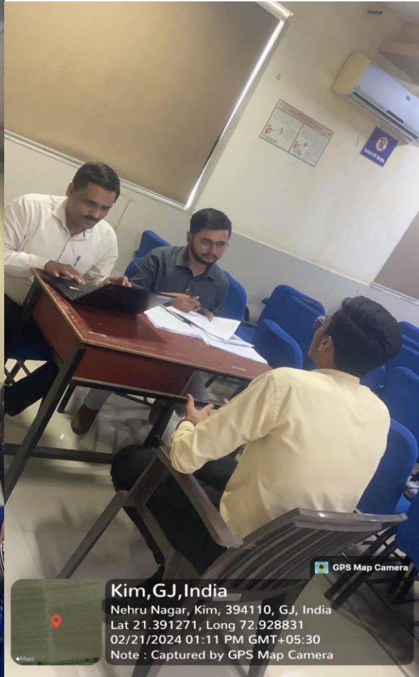
Glimpse of campus interview by Zentiva Pharmaceuticals Pvt.Ltd, Ankleshwar