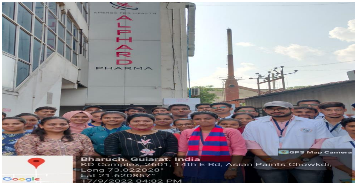
B. Pharm Students visited to alphard pharma, Ankleshwar